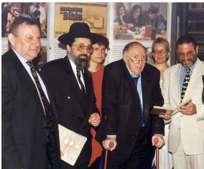
Pressekonferenz in Frankfurt: Noch zu Lebzeiten von Ignaz Bubis stellte ORT im Jüdischen Museum seine neue CD-ROM „Tour durch die Bibel“ der Öffentlichkeit vor.

„Tour durch die Bibel“ heißt die neue CD-ROM von ORT Deutschland e.V., die in diesem Jahr in Berlin, Frankfurt und Wien der Öffentlichkeit vorgestellt wurde.