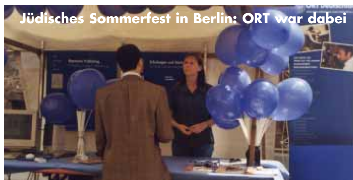
Jüdisches Sommerfest in Berlin: ORT war dabei